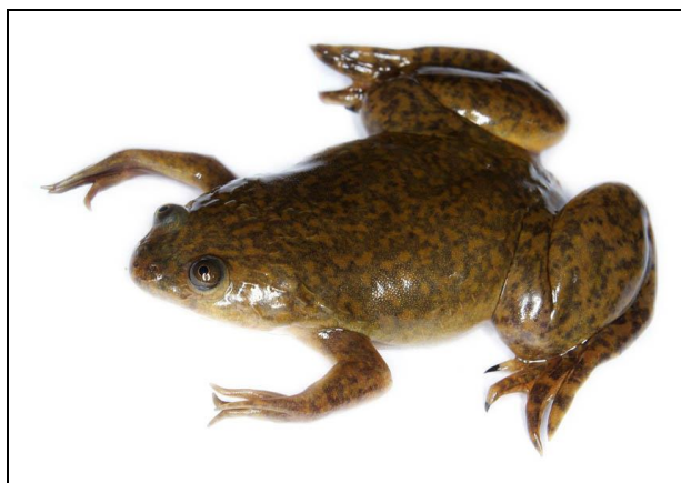
Obr 1: drápatka vodní.