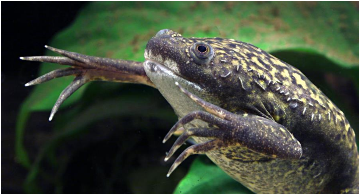
Obr 4: Na bocích světlé smyslové útvary, připomínající stehy.