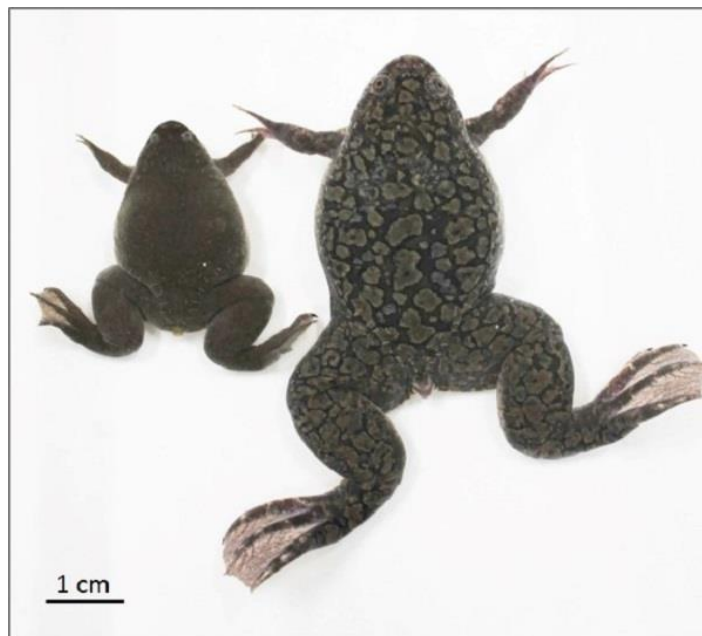
Obr 5: Rozdíl ve velikosti drápatky vodní (vpravo) a drápatky tropické.

Díky zploštělému tělu, hlavě s malými očima umístěnými nahoře lze drápatky snadno odlišit od našich druhů žab. Drápatka vodní může být nejsnáze zaměnitelná s ostatními druhy rodu z čeledi drápatka. Ve výzkumu je často využívána drápatka tropická ( Xenopus tropicalis ), která ale dosahuje zhruba poloviční velikosti.