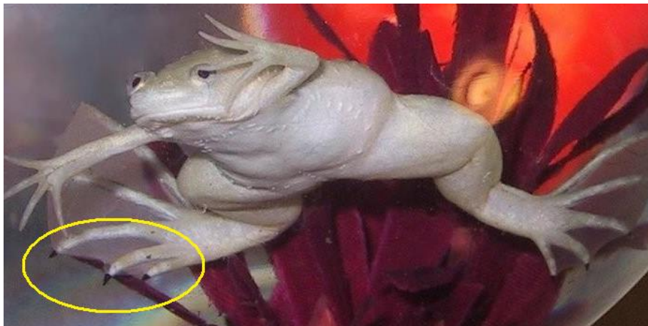
Obr. 3 Albinotická forma drápatky vodní. Na 3 prstech zadních nohou viditelné drápatky.

Samice dorůstají délky 10–15 cm a váží kolem 200 gramů. Samci jsou zhruba o třetinu menší. Tělo je zploštělé, zadní nohy jsou posunuty za tělo. Kůže hladká, s bělavými třásnitými slizničními kanálky. Hřbet je žlutohnědý, šedý či olivově zelený s tmavými nepravidelně umístěnými tečkami. Břicho má bělavé s občasnými hnědými skvrnami. V chovech existují také albínové této žáby. Hlava je malá, oči jsou dorzálně umístěné, oční víčka slabě vyvinutá. Malé přední nohy mají 4 prsty bez plovací blány. Silné zadní nohy s 5 prsty jsou opatřeny plovací blánou. Na 3 vnitřních prstech zadních nohou jsou černé drápatky – odtud rodové jméno drápatka. Na bocích mají světlé útvary, připomínající stehy. Obsahují smyslový orgán, který registruje vibrace ve vodě a umožňuje drápatce vnímat i v kalné vodě.