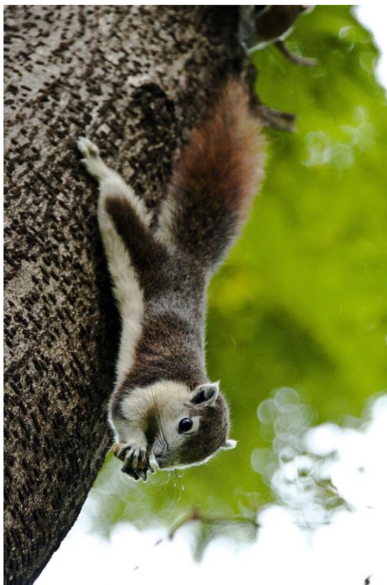
Obr 1: Callosciurus finlaysonii bocourti .

České jméno: veverka Finlaysonova Anglické jméno: Finlayson's squirrel Čeleď: Sciuridae