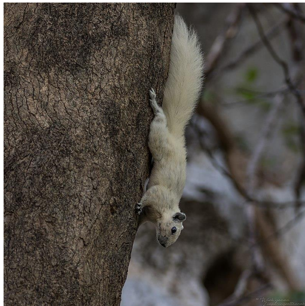
Obr 4: Veverka finlaysonova (poddruh C.f. bocourti ).

Popis: Jedná se o stromový druh veverky, který je barevně velice variabilní. Veverky mohou být zbarvené od všech odstínů bílé, červené až po černou. Samice měří v průměru 17 cm (hlava-tělo), samci v průměru 19 cm a průměrná délka ocasu je 17 cm. Průměrná hmotnost obou pohlaví je 278 g. Veverka Finlaysonova se vyznačuje denní aktivitou.