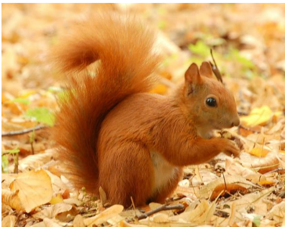
Obr. 7 Veverka obecná – rezavá forma.

Možnosti záměny: Veverka Finlaysonova se od domácí veverky obecné liší zbarvením, dále má méně huňatý ocas, uši tolik nevystupují z hlavy a v zimní srsti nemá štětinky. Veverka liščí (též na seznamu) je výrazně větší a má většinou nazrzelé zbarvení. Veverka popelavá, která je také zařazena na unijním seznamu, je o něco větší a veverka Pallasova má výrazně zrzavě zbarvené břicho.