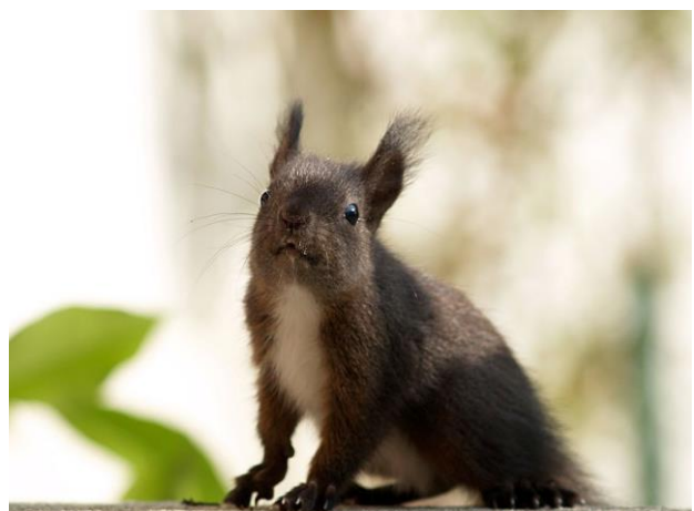
Obr. 8 Veverka obecná – hnědá forma.

Riziko: především pro domácí veverku obecnou ( Sciurus vulgaris ), kterou vytlačuje z původního území. Mezi oběma druhy navíc může docházet k páření a jejich potomstvo se může dále reprodukovat, což pro naši veverku obecnou představuje z genetického hlediska velké riziko. Veverka Finlaysonova je také přenašeč řady nemocí a patogenů, které mohou ohrozit veverku obecnou, ale i další volně žijící zvířata. Nebezpečný je také okus stromků, v Itálii zaznamenali po introdukci velké škody na vegetaci.