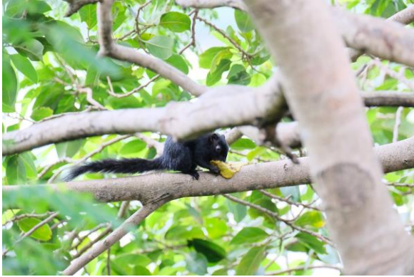
Obr 5: Veverka Finlaysonova ( C.f. germaini ). Foto: Long Vu, Vietnam