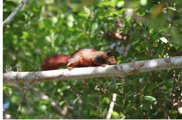
Obr 6: Veverka Finlaysonova ( C.f. cinnamomeu s. ). Foto: Wich'yanan L., Thailand

Možnosti záměny: Veverka Finlaysonova se od domácí veverky obecné liší zbarvením, dále má méně huňatý ocas, uši tolik nevystupují z hlavy a v zimní srsti nemá štětinky. Veverka liščí (též na seznamu) je výrazně větší a má většinou nazrzelé zbarvení. Veverka popelavá, která je také zařazena na unijním seznamu, je o něco větší a veverka Pallasova má výrazně zrzavě zbarvené břicho.