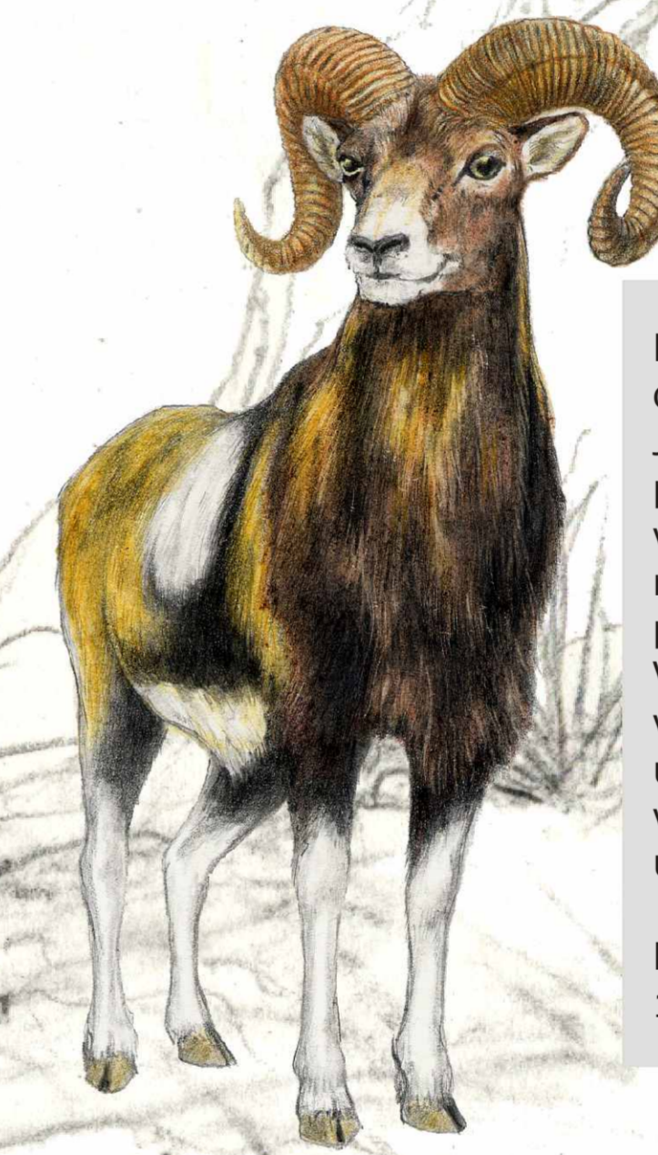
muflon ( Ovis musimon )

Aby se zamezilo škodám v zemědělství, byla divoká prasata asi před 200 lety v celé střední Evropě mimo oborní chovy vyhubena. V poválečných letech se (díky poškozeným oborám po průjezdech armády) opět dostala do volné přírody.