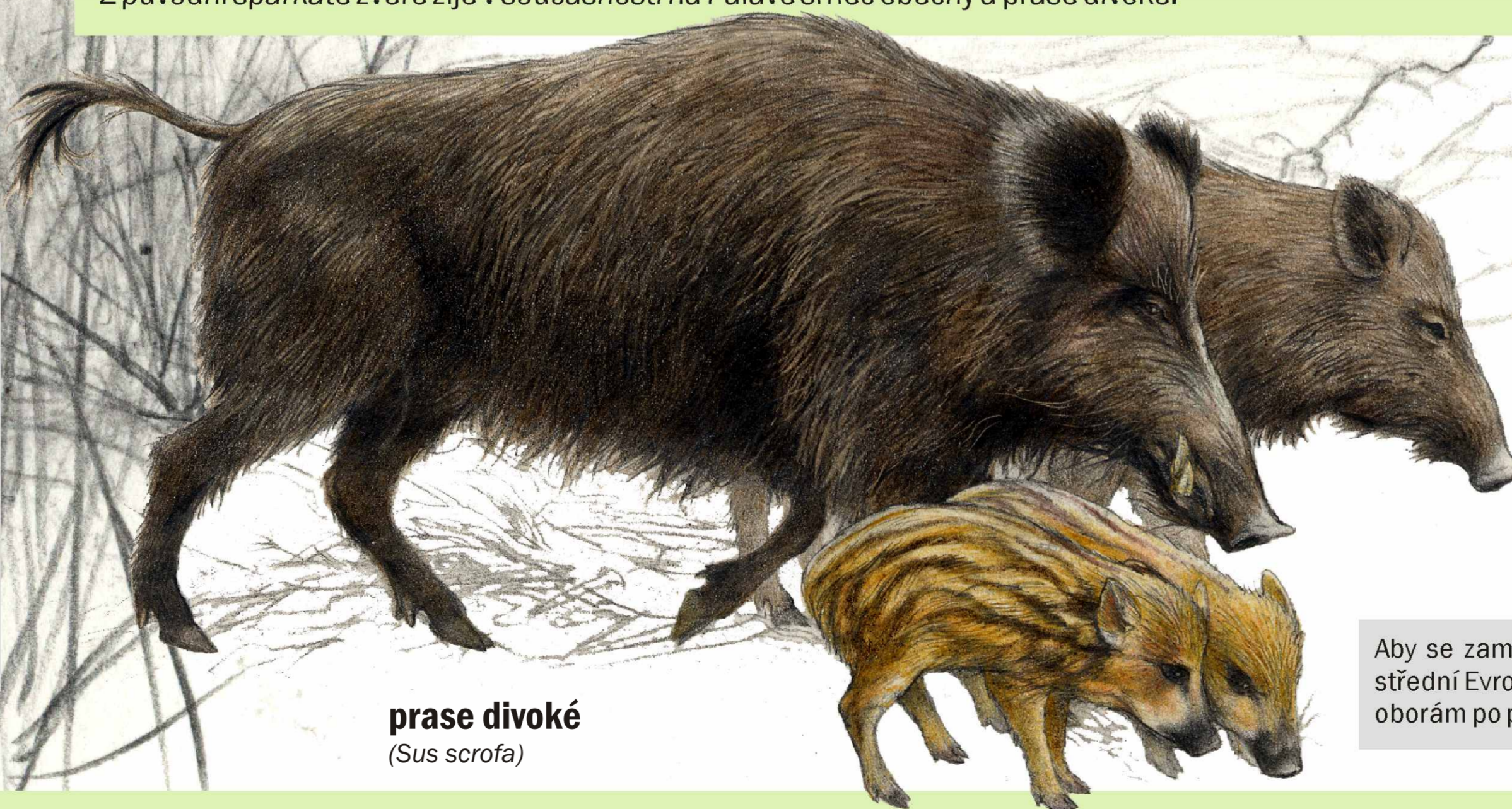
prase divoké ( Sus scrofa )

Z původní spárkaté zvěře žije v současnosti na Pálavě srnec obecný a prase divoké.