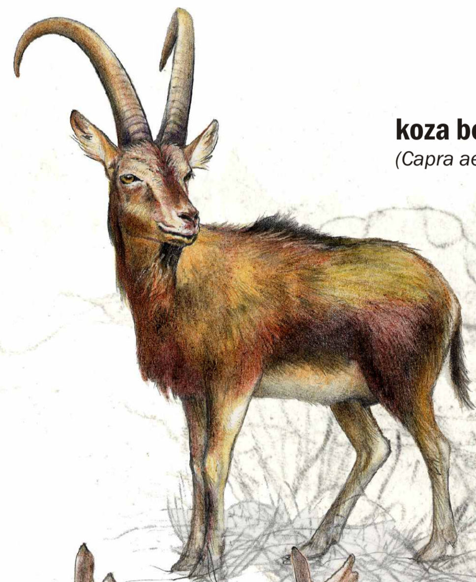
koza bezoárová ( Capra aegagrus )

Koncem 19. století byla na Děvíně založena obora. Rozsahem odpovídala zhruba ploše současné rezervace. Do obory byli nejdříve vypuštěni daňci, kteří se rychle rozmnožili: v roce 1910 jich bylo napočteno asi 400 kusů. Před první světovou válkou přibyli k daňkům mufloni, kterých zde v polovině dvacátých let žilo asi 60. V roce 1953 dostala obora další obyvatele: stádečko koz bezoárových. Přemnožená zvěř poškozovala stepní společenstva a znemožňovala přirozenou obnovu lesa. Obora byla i z těchto důvodů v roce 1996 zrušena, mufloni však na Děvíně žijí dodnes.