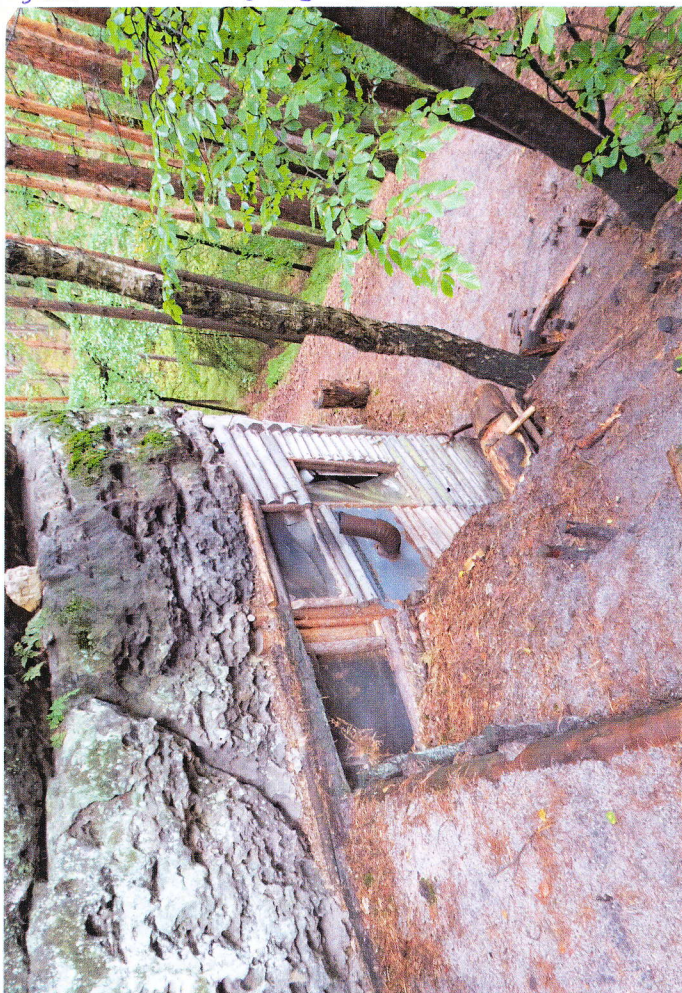
OBJEKT NA MACECE C-KU ABOTIA V.K.U. DOMASICE